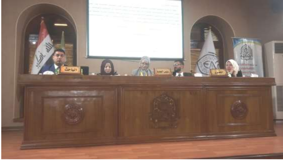
(الجلسات العلمية للمؤتمر في اليوم الثاني)