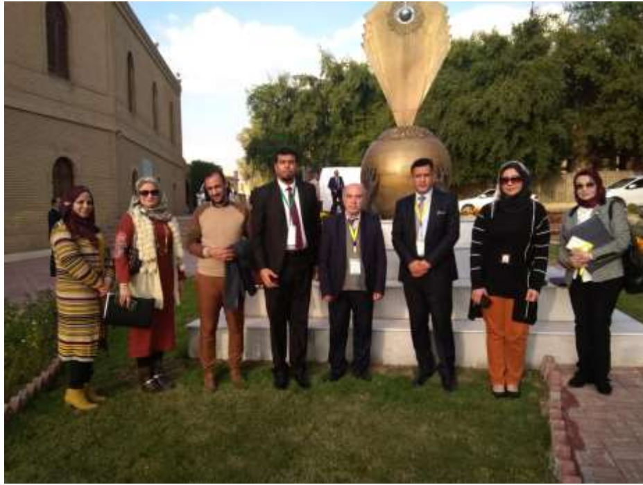
(الحضور من الكادر التدريسي لكلية التخطيط العمراني)