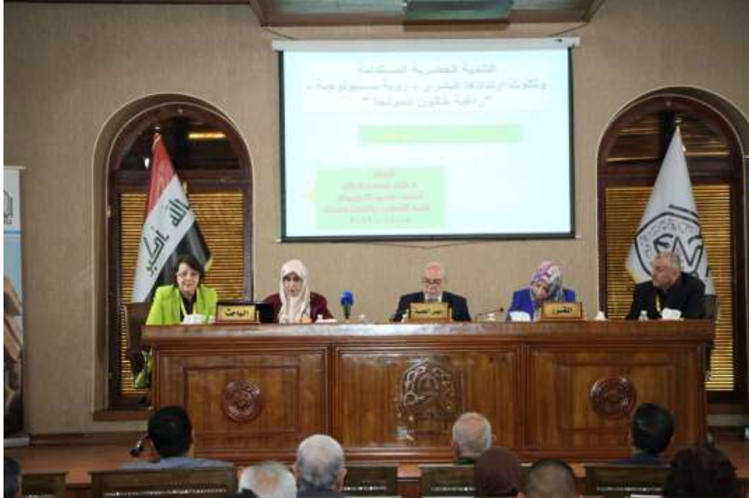
(الجلسات العلمية للمؤتمر في اليوم الثاني)