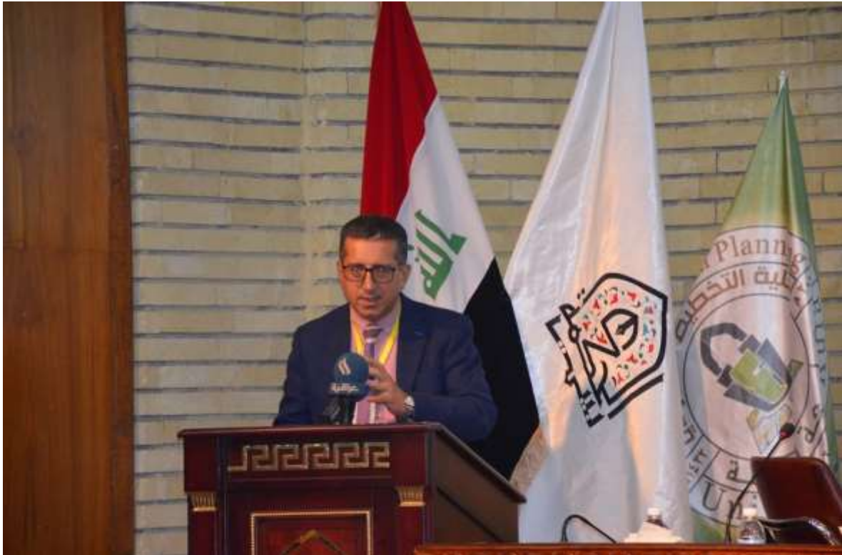
د. ثامر الحلفي - وزارة الصحة - منظمة الصحة العالمية