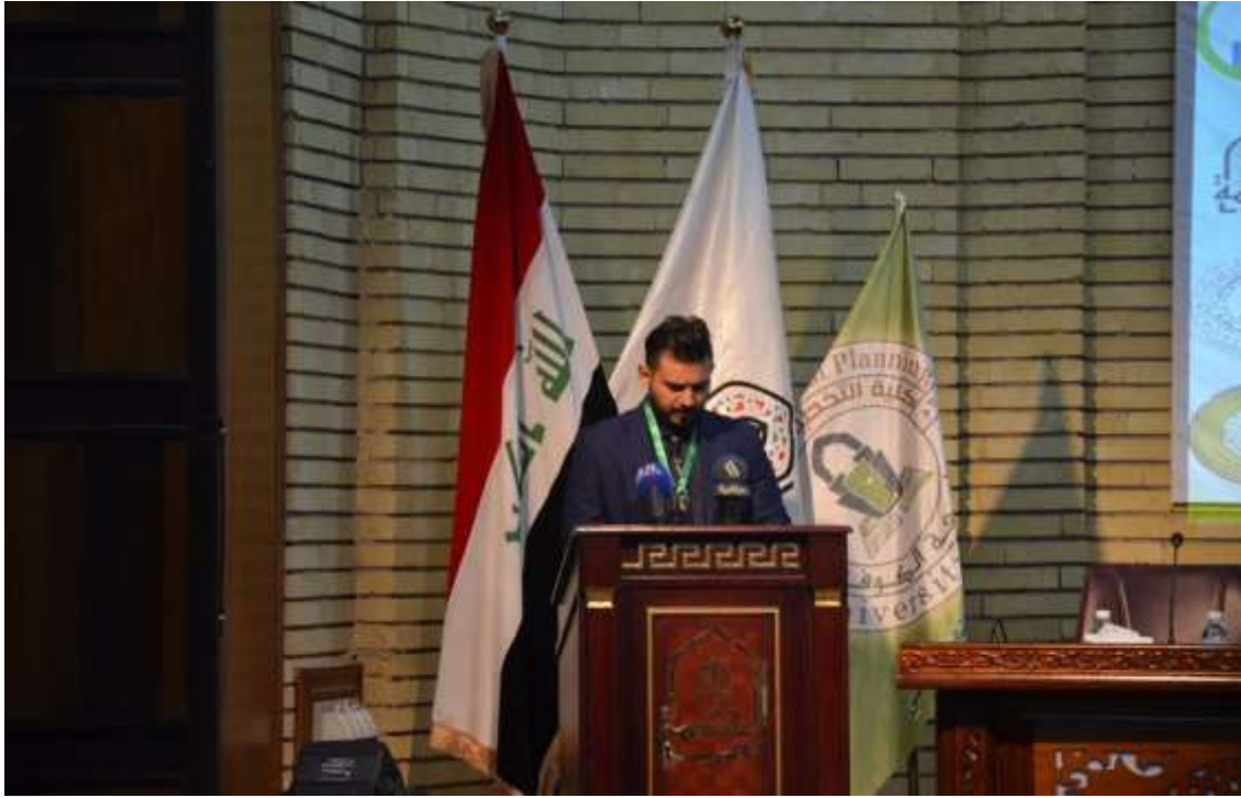
(قراءة آي من الذكر الحكيم)