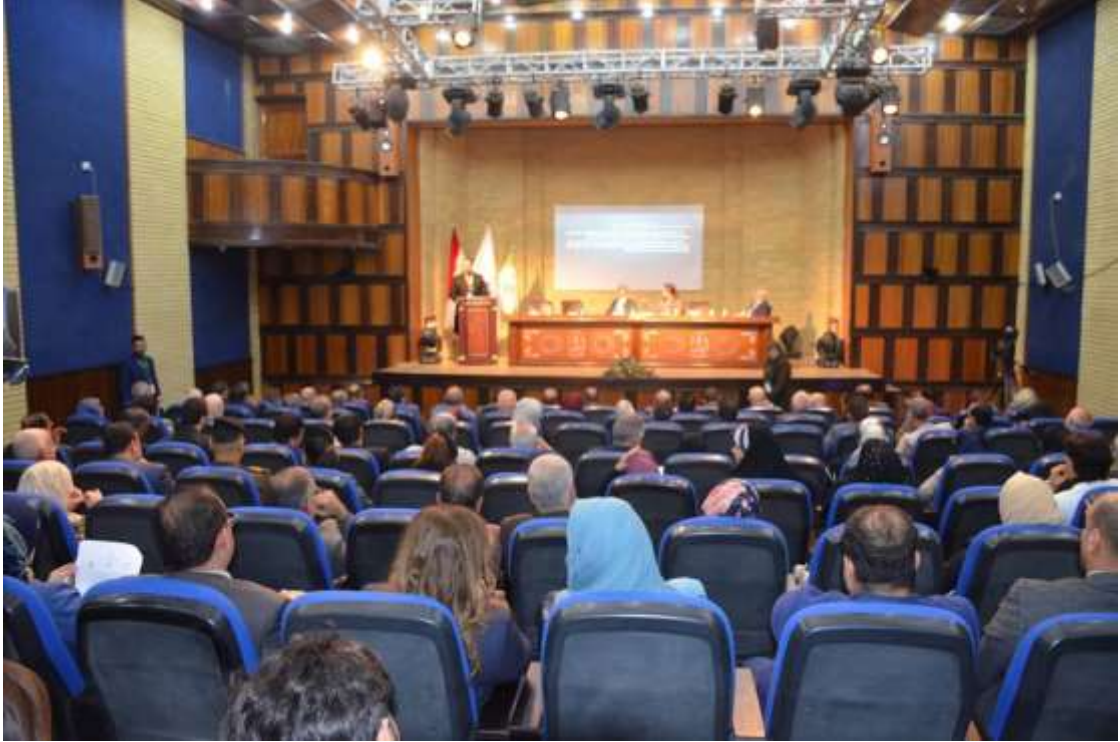
(الجلسة الافتتاحية للمؤتمر)

في تمام الساعة العاشرة يوم الأحد الموافق ٢٠١٩/١٢/٤ افتتح المؤتمر بأي من الذكر الحكيم، تلاه قراءة سورة الفاتحة المباركة على أرواح شهداء العراق الابرار.