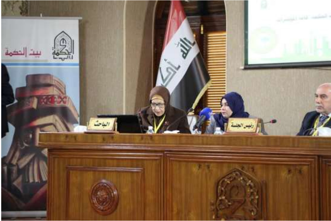
(الجلسات العلمية للمؤتمر في اليوم الثاني)