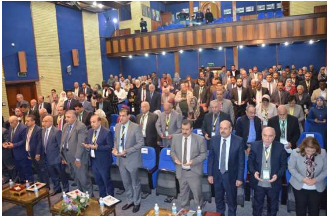
(وقوفه المشاركين لقراءة الفاتحة على ارواح شهداء الوطن)